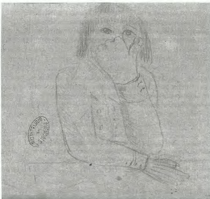
Autoportrait de Stendhal adolescent.